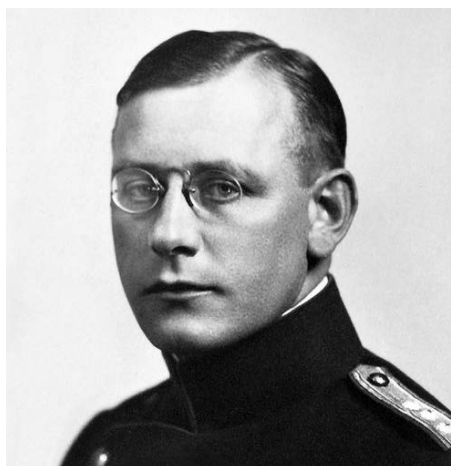
Paul Grüninger. St. Galler Polizeikommandant bis 1939