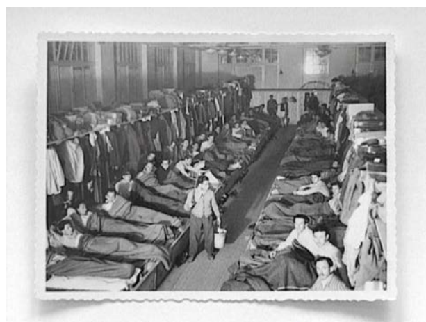
Schlafsaal in einem Flüchtlingslager bei Diepoldsau