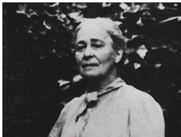
Gertrud Kantorowicz, deutsch-jüdische Kunsthistorikerin, 1942 an der Grenze bei Diepoldsau zurückgewiesen